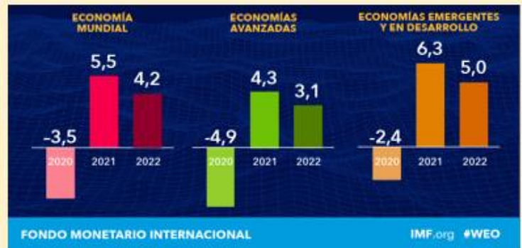
Ilustración N°1 Proyecciones de Crecimiento de Perspectiva de la Economía Mundial

Por su parte, en el Balance Preliminar de las Economías de ALC, la Comisión Económica para América Latina y el Caribe (CEPAL) estima que el PIB de la región mostrará una contracción de -7.7% en 2020, “la mayor contracción desde que se inician los registros en 1900”. Dicha situación tiene efectos sociales importantes. Según la CEPAL, la tasa de desempleo regional llegará al 10.7% en 2020, con una profunda caída de la participación laboral y un incremento considerable de la pobreza y la desigualdad. En el mismo documento la CEPAL reconoce los esfuerzos realizados por los países para mitigar los efectos de la crisis, pero también plantea como se han ampliado las brechas ya existentes en la región. Las proyecciones para el año 2021 son positivas y llega al 3.7% pero indica que la recuperación del nivel del PIB pre-crisis será lenta y se alcanzaría recién hacia el año 2024. Las debilidades y brechas de la región, la desigualdad, la escasa cobertura y acceso a la protección social, la elevada informalidad laboral, la heterogeneidad productiva y la baja productividad son vitales para comprender los efectos tan profundos de la pandemia en Latinoamérica.